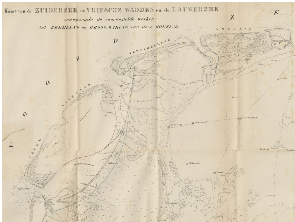
Figure 1 – A cut out of the map made by engineer B.P.G. van Diggelen in 1849.

First of all, regarding the geographical situation, maps are a selection and thus simplification of reality. 1 If this selection is based on a scientific method the map can be seen as the epistemological rendering of reality. Second, the interventions also represent a form of knowledge ; whether technical, administrative, legal or social. Often, the visual representation of these interventions includes specific conventions and rules for depicting elements and in that way, informs the reader about their status. For instance, dotted lines are often used for proposed construction works. Third, a map is also the product of the creator's own imagination .